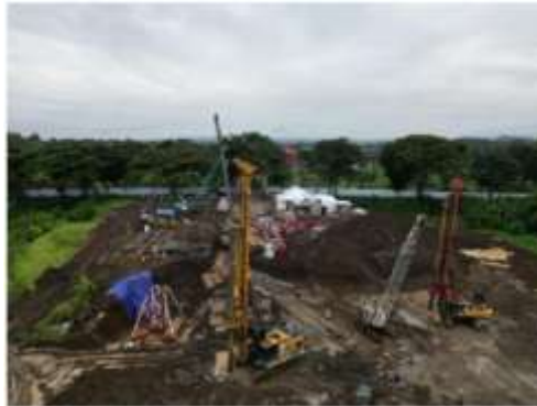
Gambar 3. Pemasangan Tower Crane

Pada proyek pembangunan Gedung Rektorat Kampus Sidotopo Universitas Tidar, Tower Crane yang digunakan adalah tipe QTZ80(5812) dengan konfigurasi travelling mechanism, artinya Crane dapat bergerak secara horizontal sepanjang jalur rel yang telah disiapkan di atas pondasi beton bertulang.