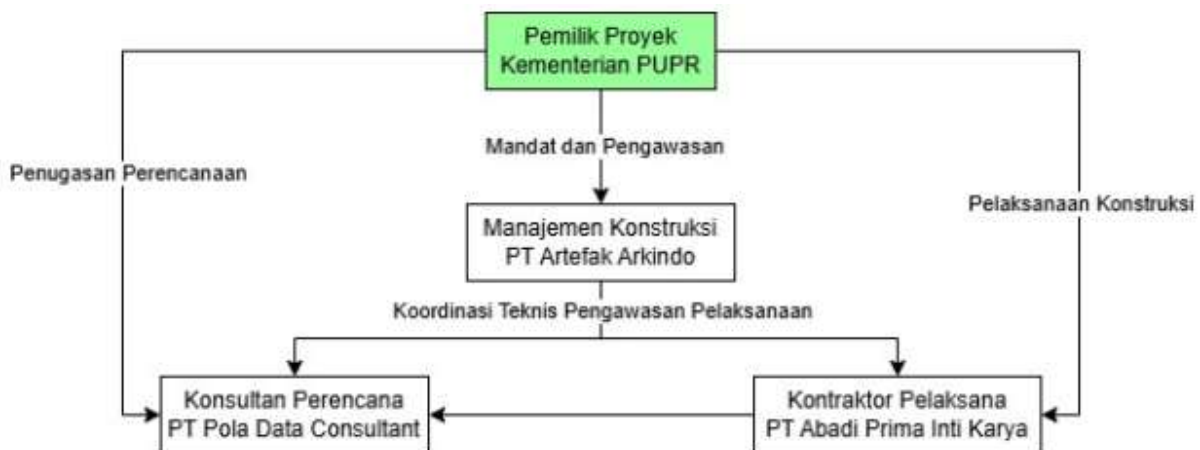
Gambar 1. Diagram Struktur Organisasi Pengelola Proyek

Struktur organisasi ini bertujuan untuk menjamin pelaksanaan proyek berjalan efektif dan efisien, serta memudahkan proses pengambilan keputusan, pengawasan mutu, waktu, dan biaya. Hubungan antar pihak bersifat formal dan didasarkan pada perjanjian kontraktual yang mengikat sesuai peraturan konstruksi dan perundang-undangan yang berlaku. Gambar 1 merupakan diagram struktur organisasi pada proyek terkait.