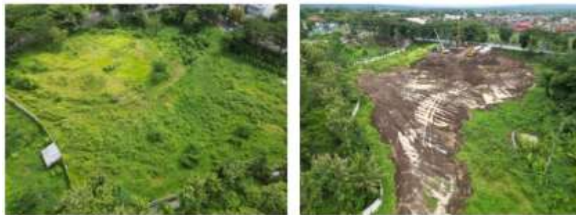
Gambar 2. Pekerjaan Persiapan.

Pekerjaan persiapan merupakan tahapan awal sebelum pekerjaan utama konstruksi dimulai. Tahapan ini sangat penting karena menjadi landasan bagi seluruh kegiatan selanjutnya dalam pelaksanaan proyek. Dalam proyek pembangunan Gedung Rektorat Kampus Sidotopo Universitas Tidar Tahap II, kegiatan persiapan meliputi pembersihan lahan, pengukuran ulang, pemasangan pagar pengaman, penyiapan akses kerja, penyediaan fasilitas umum proyek (kantor lapangan, gudang, toilet), hingga mobilisasi alat berat. Salah satu kegiatan penting dalam pekerjaan persiapan ini adalah pelaksanaan penyelidikan tanah (borelog) sebagai dasar perencanaan dan pelaksanaan fondasi dalam (bored pile).