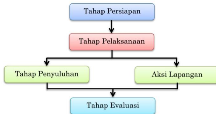
Gambar 2. Tahapan Pelaksanaan Kegiatan