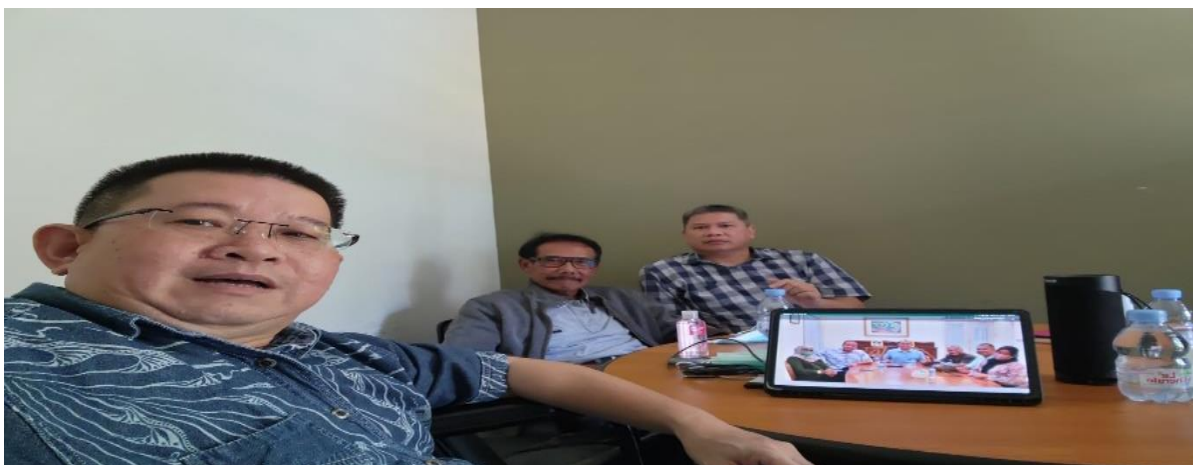
Gambar 4. Pelaksanaan Pengabdian Masyarakat