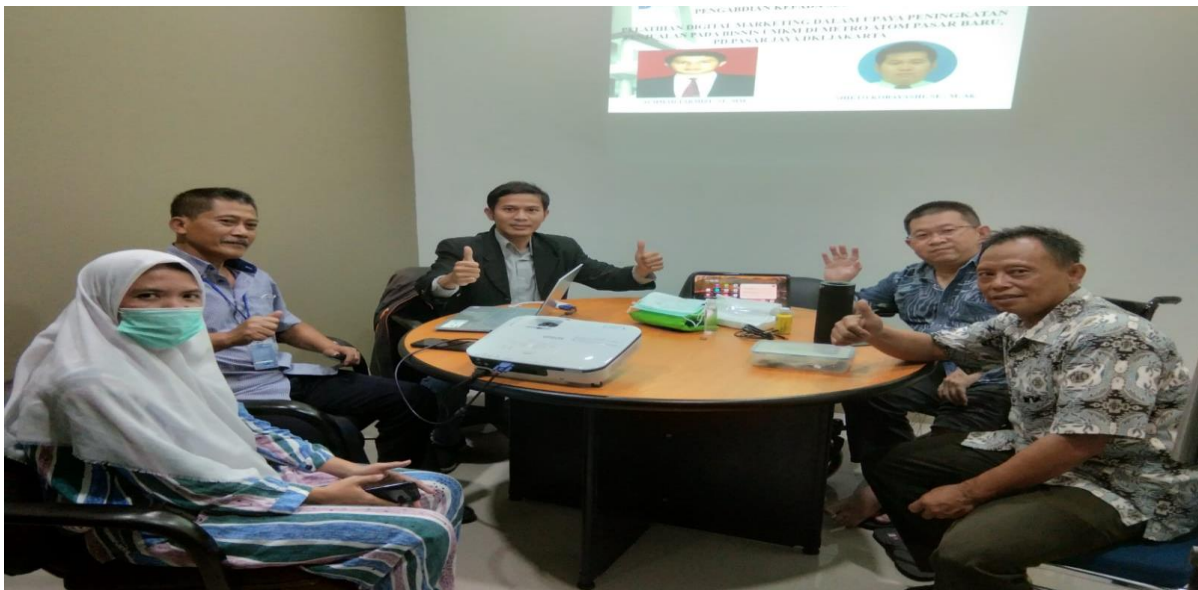
Gambar 3. Pelaksanaan Pengabdian Masyarakat