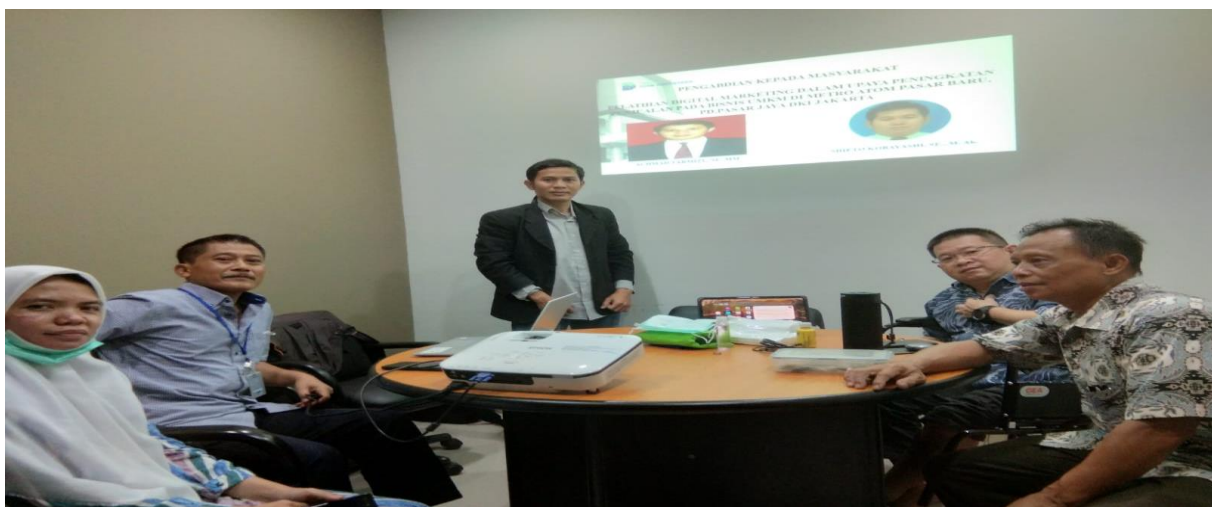
Gambar 2. Pelaksanaan Pengabdian Masyarakat