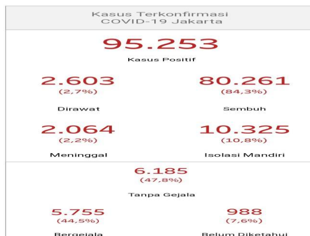
Gambar 2. Jumlah Terpapar Virus Covid-19 Di Jakarta

Berdasarkan analisis situasi tersebut diperlukan adanya suatu upaya untuk memberikan solusi alternatif yang mampu meningkatkan kembali Pola Hidup Sehat Dan Bersih Masyarakat. Menciptakan lingkungan hidup yang nyaman , asri dan aman juga merupakan salah satu cara agar terhindar dari penularan virus Covid-19. Pada masa New Normal ini, kita tetap dapat menjalankan aktivitas namun dengan ditambah menerapkan protokol kesehatan guna mencegah terjadinya penularan Covid 19.