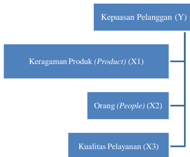
Gambar 3. Kerangka Pemikiran Teoritis

Berdasarkan penjelasan di atas, maka kerangka pemikiran dalam penelitian ini dapat digambarkan sebagai berikut: